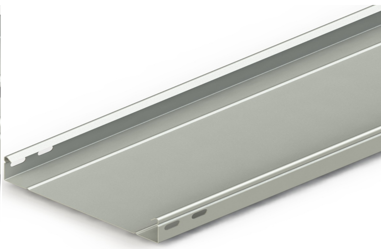
H40 HD SERIES CABLE TRAY LOAD GRAPH (TS EN 61537)